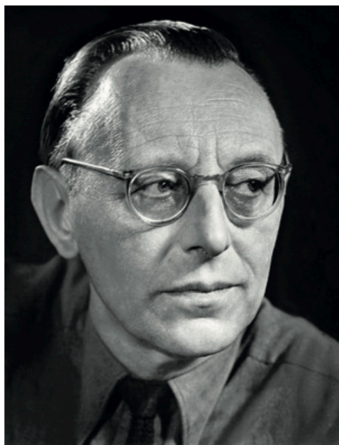
Photographie - Carl Orff - 1956